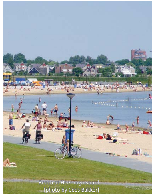
Beach at Heerhugowaard