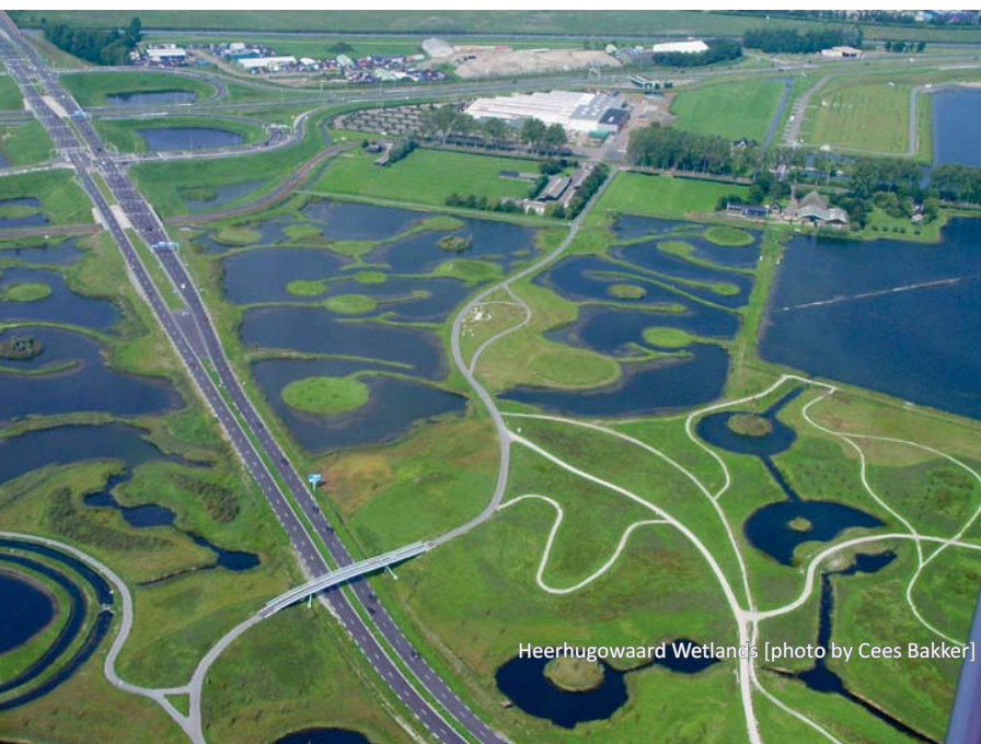
Heerhugowaard Wetlands