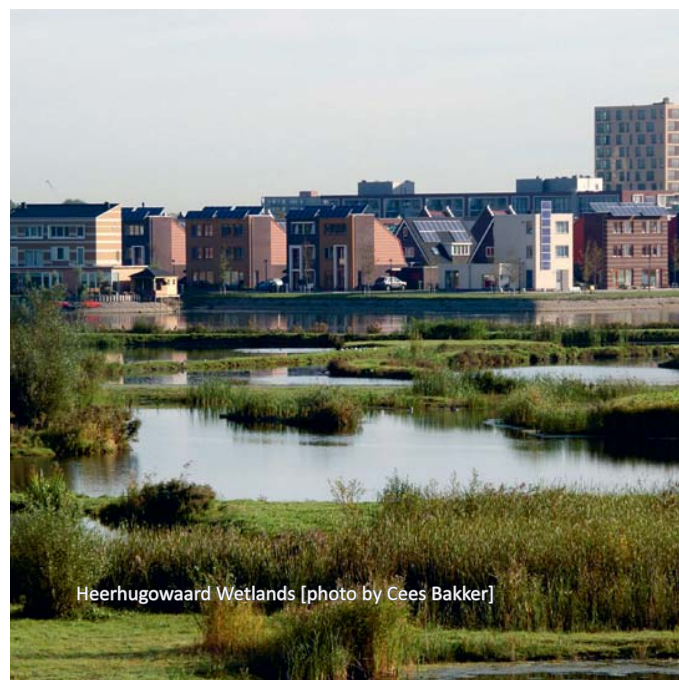
Heerhugowaard Wetlands