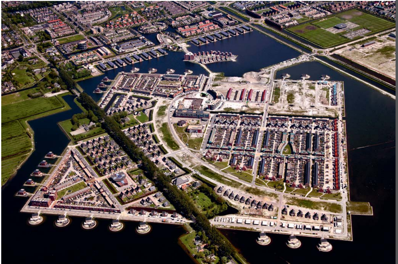
Stad van de Zon, Heerhugowaard

De Stad van de Zon is de eerste CO 2 -neutrale wijk in Nederland waarin bovendien veel aandacht aan het wijkwater werd besteed. Het grote aandeel wijkwater in de Stad van de Zon (circa 33%) dient als waterberging en voor recreatie. De Stad van de Zon dankt haar naam aan de grote hoeveelheid zonnedaken die voldoende energie opwekken om het hele elektriciteitsverbruik van de 1400 woningen af te dekken.