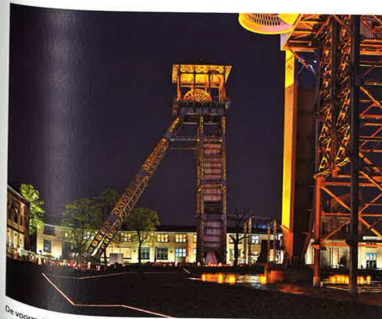
De voormalige mijngebouwen rond het plein en de mijnschachtbokken zijn gerestaureerd. De schachtbokken worden uitgelicht als een baken.