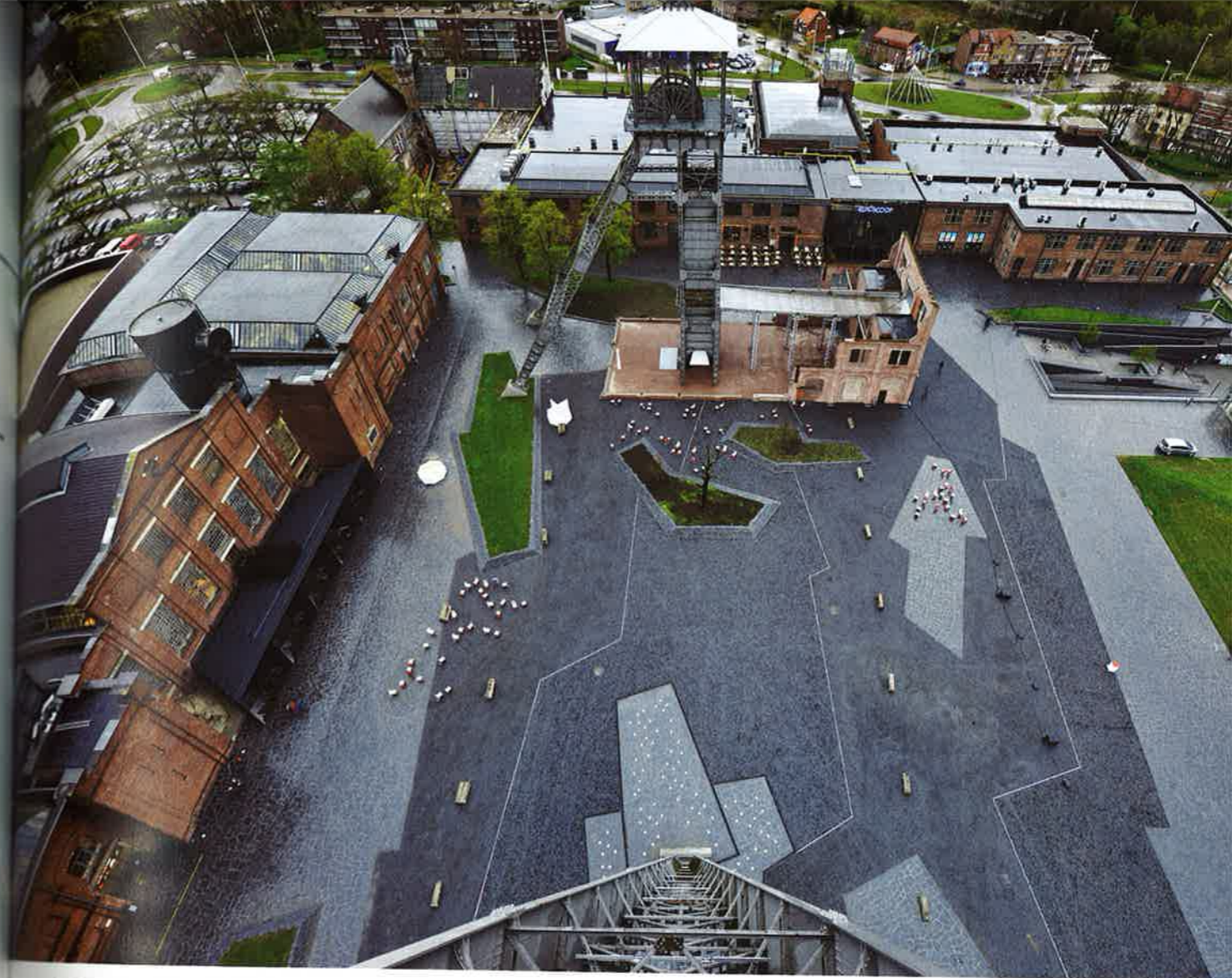
De C-Mine kreeg een stedelijk evenementenplein dat refereert aan de voormalige mijnfunctie maar ook nadrukkelijk nieuw is.