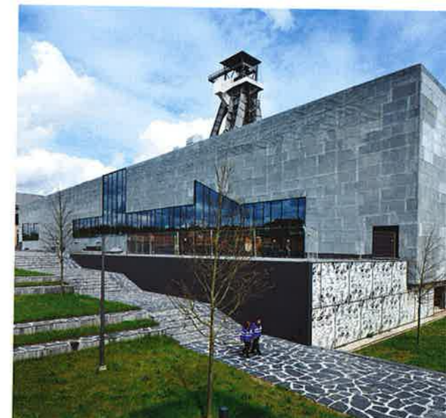
De nieuwbouw van de faculteit Media, Arts and Design van de Katholieke Hogeschool Limburg.