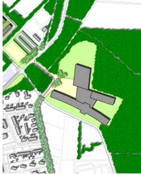
Brede School centraal tussen de kinderrijke buurten, sportvelden, volkstuinten en het Padenbos