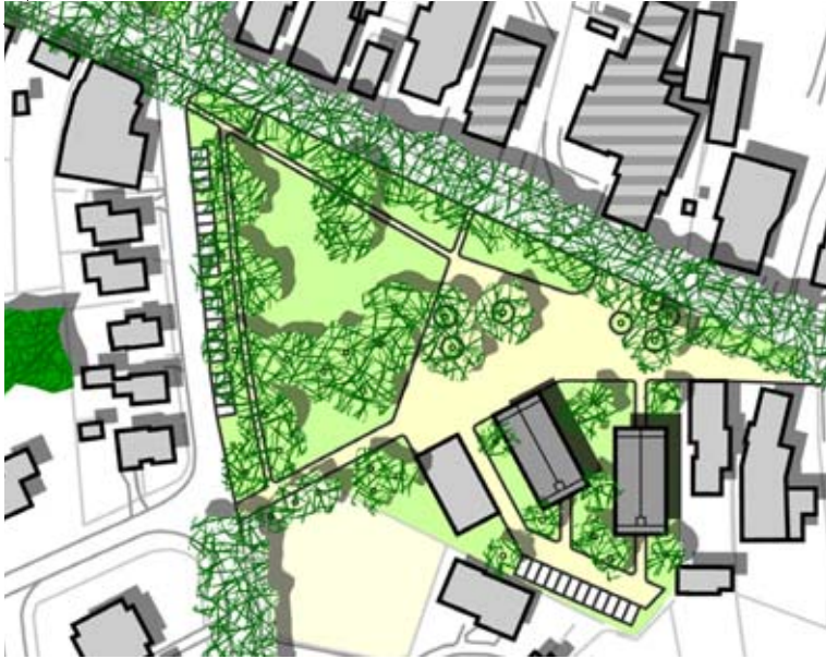
wonen aan een gezellig dorpshart