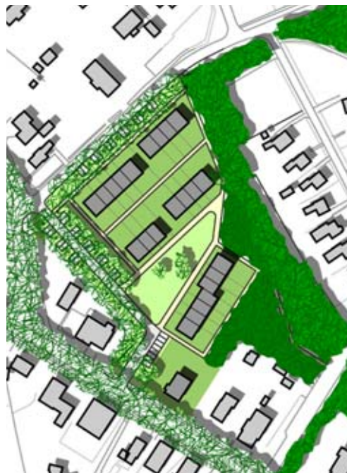
wonen aan een groen hofje