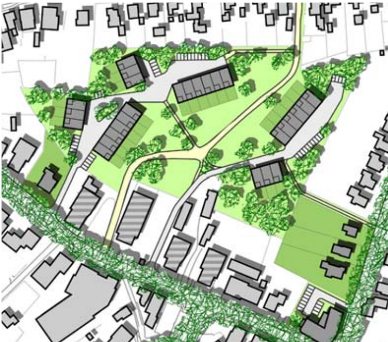
wonen op groene erfen