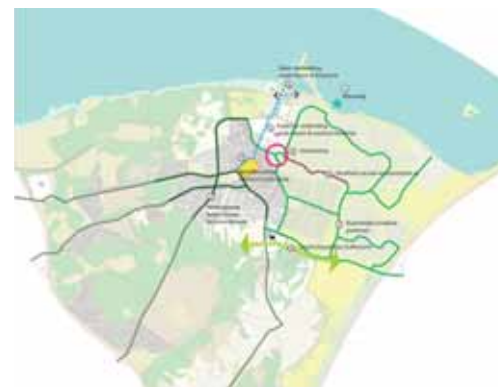
kansen voor verbetering