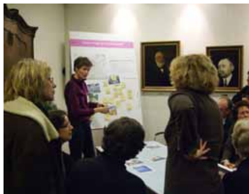
beelden Huizer Toekomst Avond