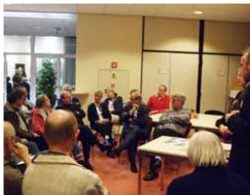
beelden Huizer Toekomst Avond

De bestaande ruimtelijke kwaliteiten en de kansen die er zijn voor verbeteringen vormen de basis voor de Structuurvisie. Deze zijn verwerkt in zes strategieën die ingaan op wonen, werkgelegenheid, infrastructuur, het bos- en heide gebied, het historische hart en de kust. De zes strategieën zijn ruimtelijk uitgewerkt in de structuurvisie.