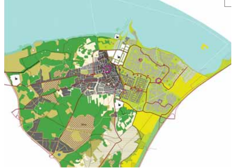
analyse 2004 Huizen