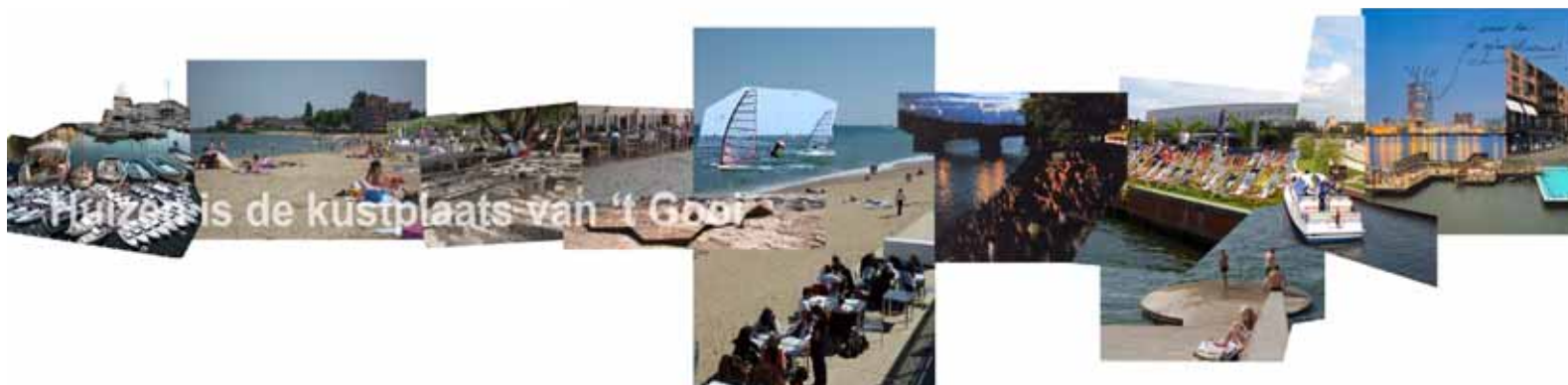
sfeerimpressie uitwerking strategie "Huizen is de kustplaats van 't Gooi", gebaseerd op door bewoners opgehangen referentiebeelden tijdens Huizer Toekomst Avond