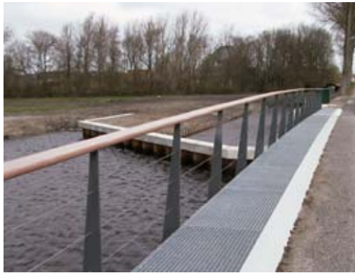
brug middenweg schrikstrook