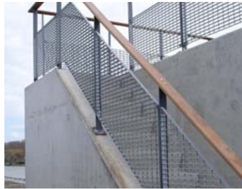
hekwerk uitzichtsplateau op circulatiegemaal