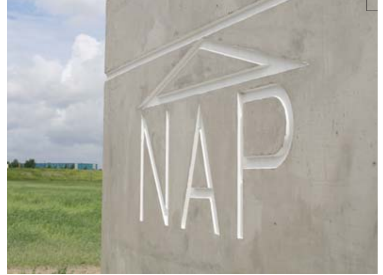
aanduiding NAP-niveau op het circulatiegemaal