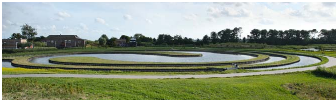
waterinlaat van het stromingslabrynth