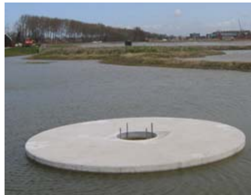
inlaat in strominglabrynt / rechts uitlaat