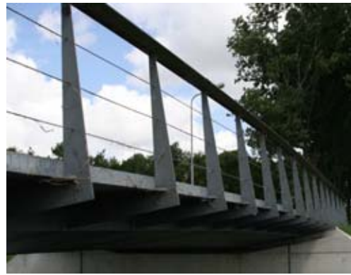
leuning brug middenweg