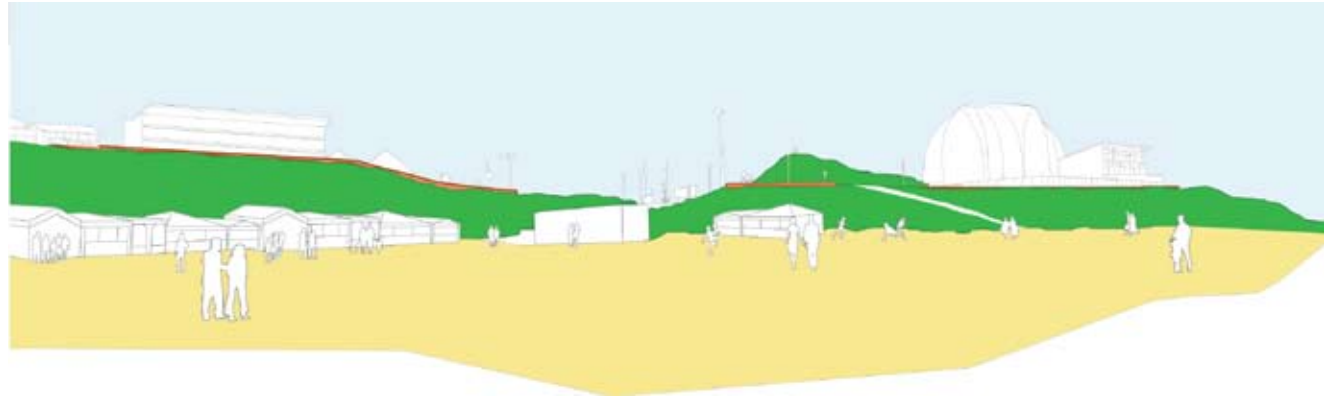
geen badplaats maar een bijzondere strandenclave