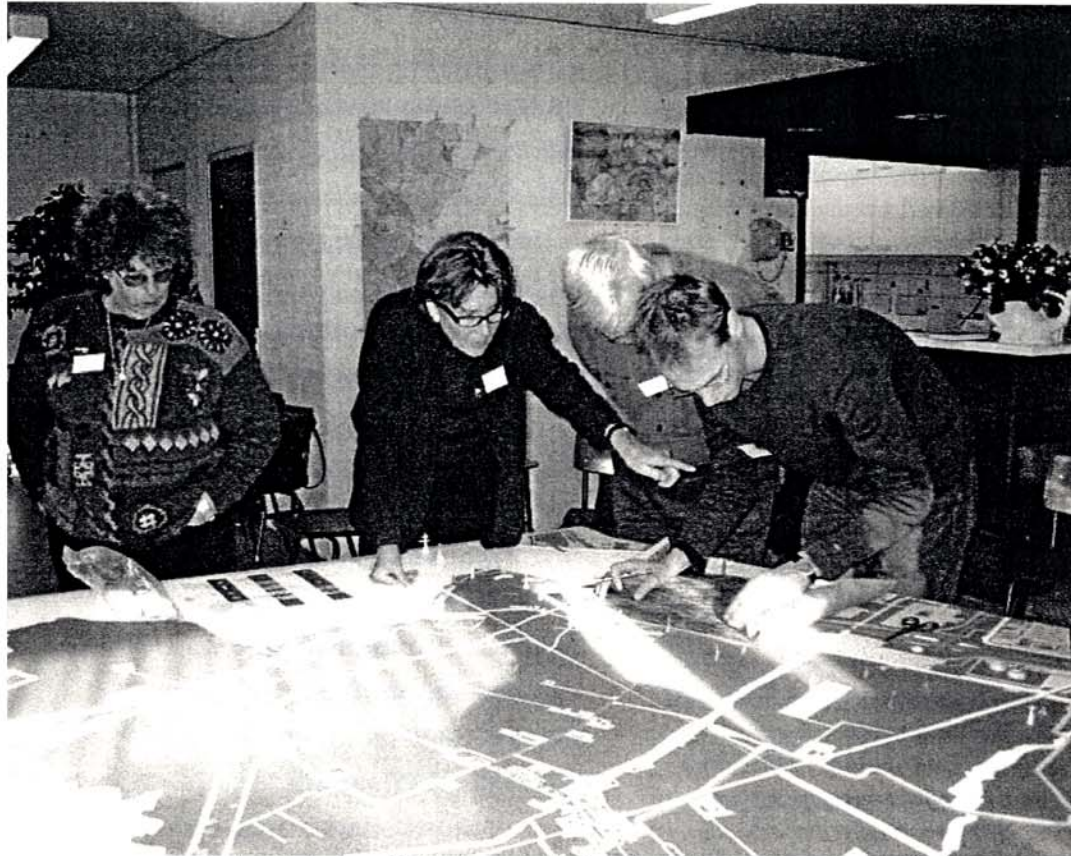
Participatie in de praktijk: natuurontwikkelingsplan Waterland

maar het contact met de mensen die mede die identiteit vormgeven en het gebied het beste kennen werd nooit gelegd. Door juist met die mensen te praten krijg je handvatten aangereikt die je helpen bij het ontwerpen. Die eerste fase is dus heel erg waardevol. Het geeft veel voldoening als je deze drie fasen goed kan doorlopen samen met de mensen. Ik vind dat altijd heel erg persoonlijk. Het is prettig als mensen achteraf naar je toe komen om te zeggen dat het een goed proces was met een mooi resultaat. Die interactie vergroot het plezier in je werk. En de toekomstige gebruikers krijgen gelijk een gezicht.'