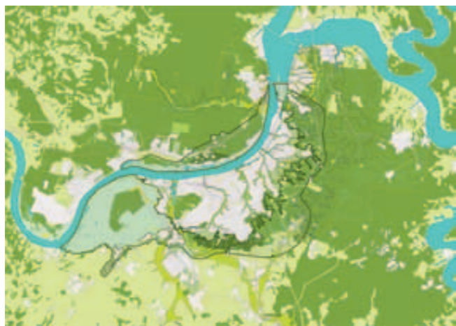
Bureau Hosper bracht de landschappelijke kenmerken van de stad in kaart. Goed zichtbaar zijn de groene valleien.