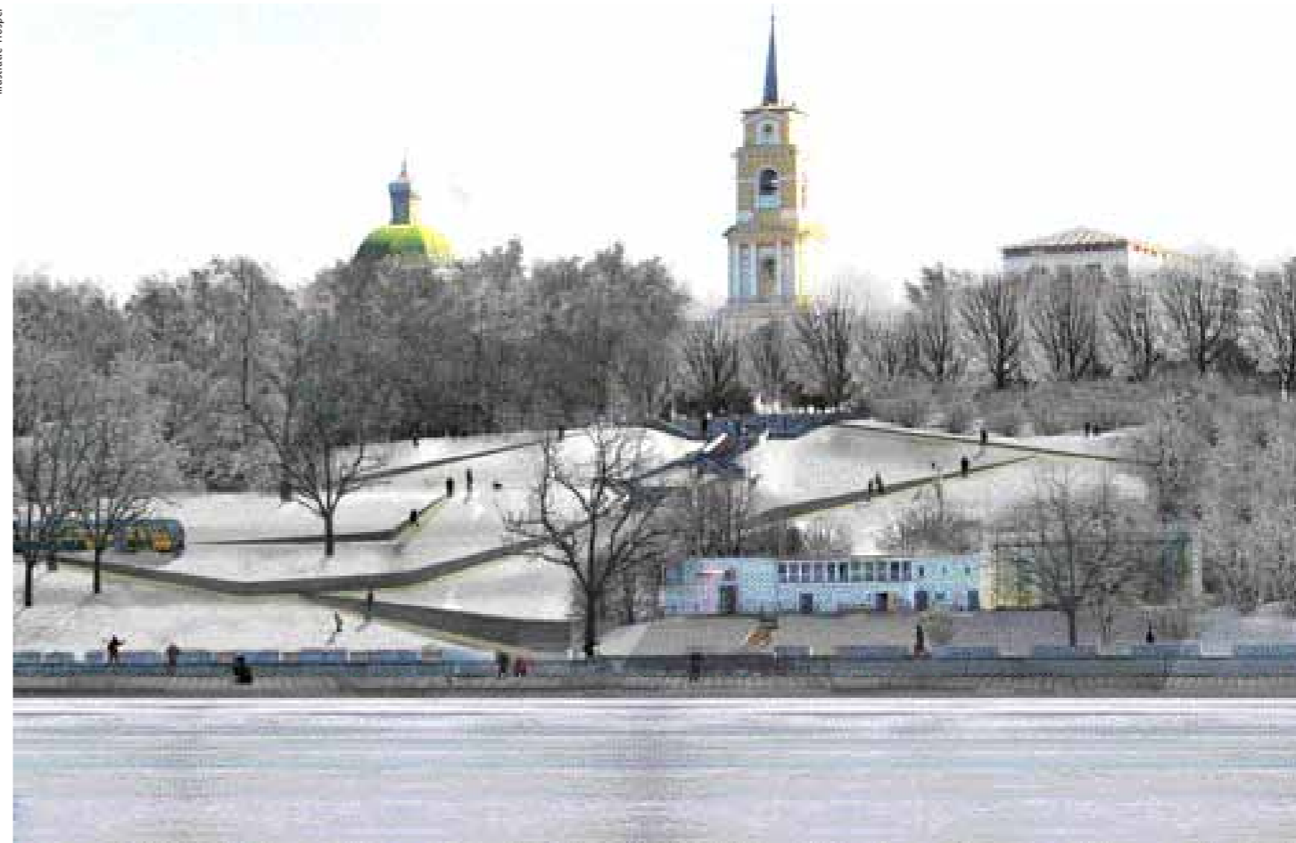
Impressie City Park.