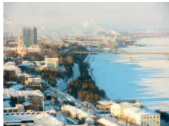
Het huidige waterfront van Perm.

Op de vraag of werken in Rusland de ontwerpers goed is bevallen, antwoorden zij positief. Ze zijn te spreken over de vrijheid die zij in het proces van het ontwerp gekregen hebben, waardoor het bijvoorbeeld mogelijk was om zelf te ontwerpen aan meubilair voor het park. Ook het ontsnappen aan de stroperige Nederlandse overlegcultuur is wel eens prettig. Er zijn minder partijen betrokken waardoor er meer controle ontstaat in het project en ontwerpkeuzes meer in eigen hand gehouden kunnen worden. Hierdoor ben je als ontwerper in staat een meer compleet plan uit te dragen.