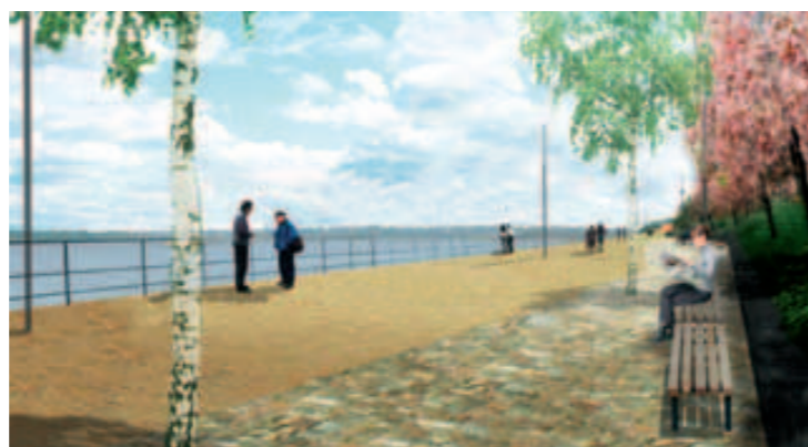
Impressie van de boulevard aan de waterkant.