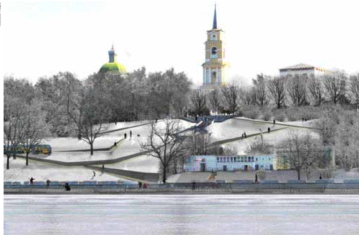
Impressie vanaf de rivier op het nieuwe Perm Embankment City Park.