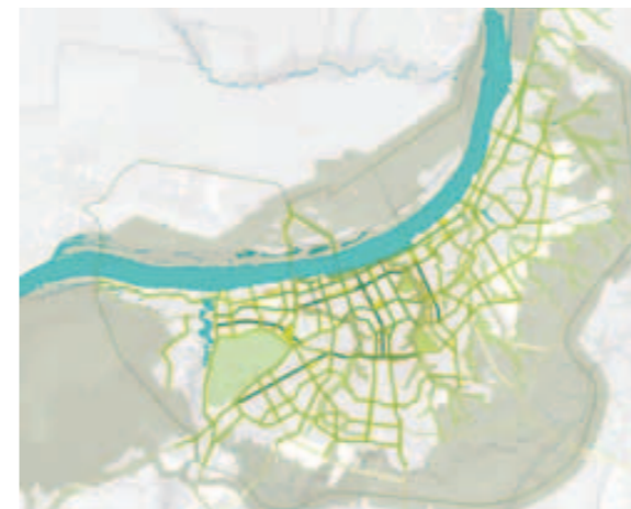
Het netwerk van openbare ruimten.

de Russen de stad voor buitenlanders en Russen van buiten Perm. Tot 1989 bleef Perm een gesloten stad. Op oude Russische kaarten kun je speuren wat je wilt, maar tref je de stad niet of op een gefingeerde locatie aan. De stad was voor buitenstaanders gewoonweg onzichtbaar. Nog steeds is Perm, ondanks een miljoen inwoners, een relatief onbekende stad.