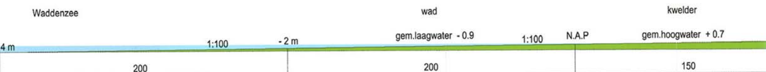
Afsluitdijk, brede dijk.

Voor de initiële aanleg van de kwelders is veel zand nodig. Dit zand kan in de Noordzee worden gewonnen en dan met schepen naar de haven van Den Oever worden gebracht. Van daar kan het met een pijpleiding langs de Afsluitdijk naar de plaats van de bestemming worden gepompt. Dit is echter een lange en ook dure transportweg. Er zijn daarom ook andere mogelijkheden verkend. Eén daarvan is het klappen van in de Noordzee gewonnen