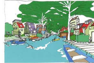
Transformatie van de openbare ruimte lokt investeringen uit in het naoorlogse vastgoed.

re op water gerichte woonvormen in Amsterdam aan te vullen. De Watervrijstaat Gaasperdam begint vorm te krijgen.