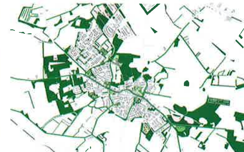
Situatie nieuw: inbreiden