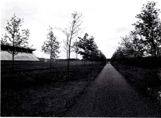
Fietspad bij de gasopslag Langelo.

Een 'typisch Alle Hosper-ontwerp' bestaat niet. 'De ruimte is al vol genoeg', schrijft Noël van Dooren in de monografie van de veelzijdige ontwerper. 'Er is geen plaats voor een persoonlijk statement in het landschap. Alle Hosper wilde dat het ontworpen landschap vanzelfsprekend zou zijn.' Een typisch Nederlandse houding, aldus Van Dooren. 'De Nederlandse landschapsarchitect is geen "architect" die bouwwerken aflevert die gebouwd worden zoals ze getekend zijn en die langdurig herkenbaar zijn als een werk van een met name te noemen auteur. De projecten waarmee dit vakgebied zich bezighoudt, kenmerken zich door grote maten, lange tijdsduur en vele betrokkenen.' Misschien is de carrière van Hosper ook wel typisch Nederlands te noemen. Hij studeerde in Wageningen, liep stage bij Staatsbosbeheer, werkte onder meer bij het Projectbureau