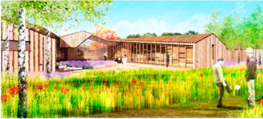
Hosper/Onix architecten zet in op de belevingswaarde van de architectuur, op het beeld van huiselijkheid en de nadrukkelijke aanwezigheid van het landschap

Dierendonckblancke Architecten baseert zich op het organisatieschema van de bestaande paviljoenen. Alleen de beeldtaal wordt geactualiseerd. In het voorstel wordt de metafoor van het huis tot voornaamste vormelijke motief gemaakt. De nieuwe paviljoenen krijgen een uitgesproken dakvorm. De verschillende woningen vormen samen een kleine nederzetting gegroepeerd rond een woonerf. Het drukke verkeer in het park wordt afgeremd door een poortgebouwtje dat de ingang van de woningengroep markeert.